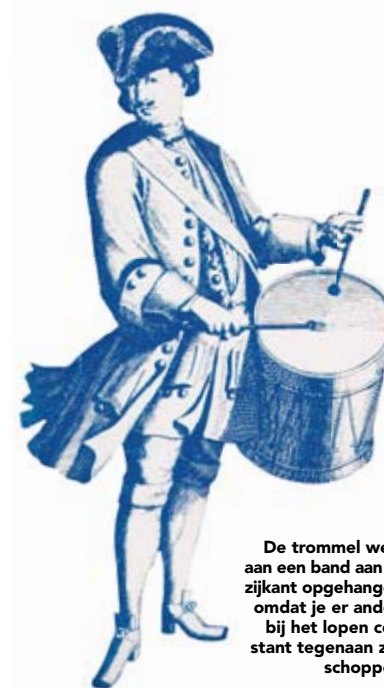
De trommel werd aan een band aan de zijkant opgehangen, omdat je er anders bij het lopen constant tegenaan zou schoppen.

We kunnen er dus vanuit gaan dat mensen al heel lang geleden met trommels gingen lopen. Omdat die trommels vrij diep waren kon je ze niet voor je hangen, je zou er immers constant tegenaan schoppen bij het lopen. De trommel werd daarom aan een band aan de zijkant opgehangen. Aangezien de matched grip in die houding erg lastig is, werd wat we nu de 'traditional grip' noemen gebruikt. Die aanpassing gold natuurlijk alleen voor de linkerhand, want de rechter kon in de normale houding slaan.