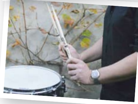
Een ongewenste polsstand bij harde slagen met de Franse grip (boven) en de Duitse grip (onder)

>> Daardoor moest je wel een van de bovenstaande bewegingen gebruiken. Zo voorkwam de leraar dat de pols in een ongezonde hoek werd bewogen.