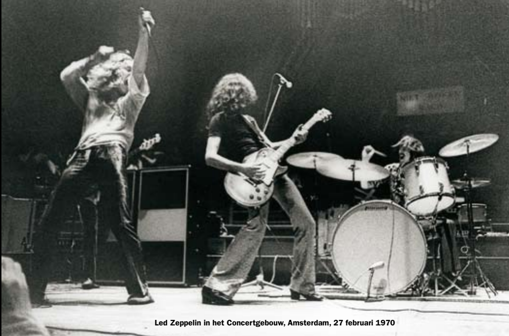
Led Zeppelin in het Concertgebouw, Amsterdam, 27 februari 1970