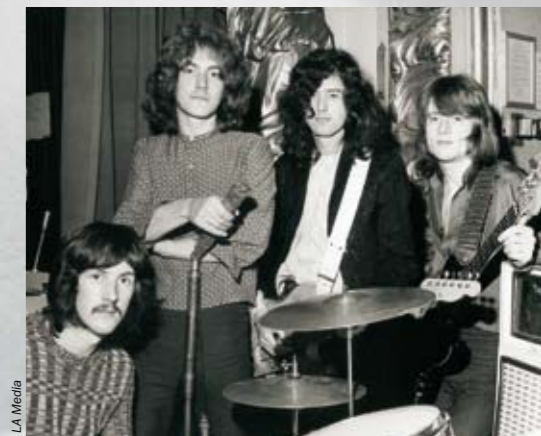
Led Zeppelin in 1969 met v.l.n.r. John Bonham, Robert Plant, Jimmy Page en John Paul Jones

Bonham slaat in die tijd al zo bizar hard, dat de meeste clubs de bandjes waarin hij speelt niet toe-