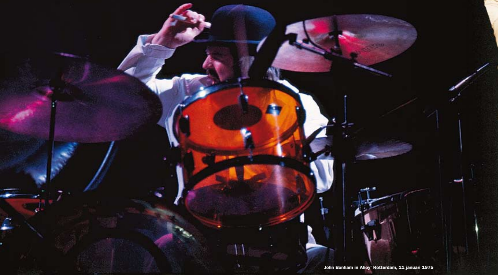
John Bonham in Ahoy, Rotterdam, 11 januari 1975