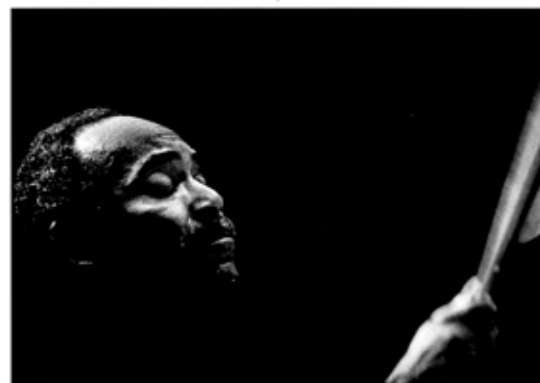
'...als een drummer zelf een solo geeft, doet ie dat alleen. Helemaal alleen..'