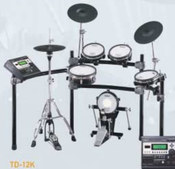
TD-12K V-Drums V-Stage Series