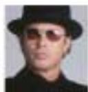
Chad Smith Red Hot Chili Peppers