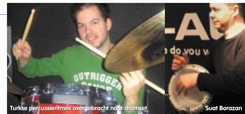
Turkse percussieritmes overgebracht naar drumset

Luister: cd Trio Chemirani - Qalam Kar Kijk: http://www.youtube.com/watch?v=p1nzg0s8HhE (video) Surf: www.thebigbang.nl