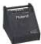
PM-10 Personal Monitor Amplifier