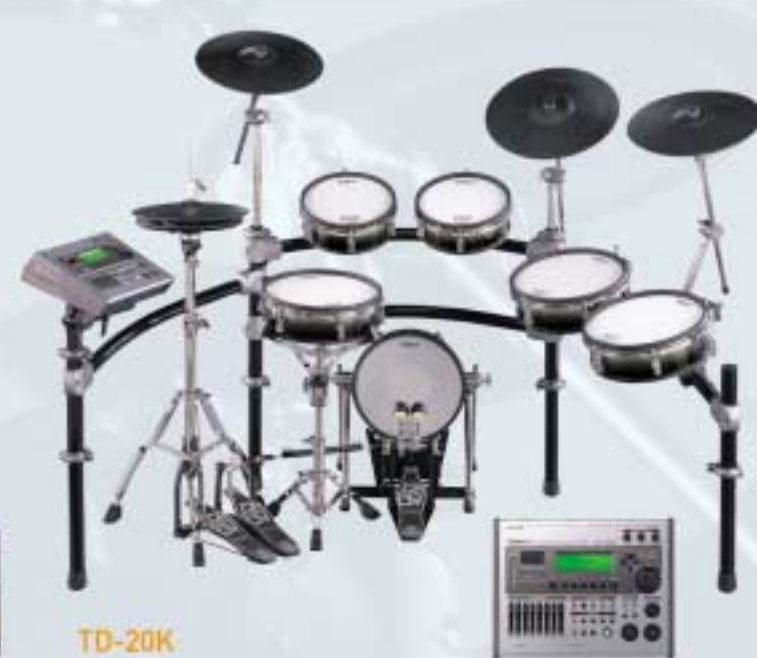
TD-20K V-Drums V-Pro Series

De Roland TD-3KW is weliswaar de kleinste, maar wel een volwaardige V-Drums®-set. Deze uitbreidbare set omvat de nieuwe TD-3 Percussion Sound Module met splinternieuwe geluiden en effecten (ambiances), nieuwe robuuste pads (dubbeltrigger voor snare en HiHat) en bewegende dubbeltrigger cimbaalpads, een verticale basdrumtrigger, Rhythm Coach metronoom met interactieve en uitdagende oefenfuncties en nog veel meer. En dit alles voor een verrassende prijs.