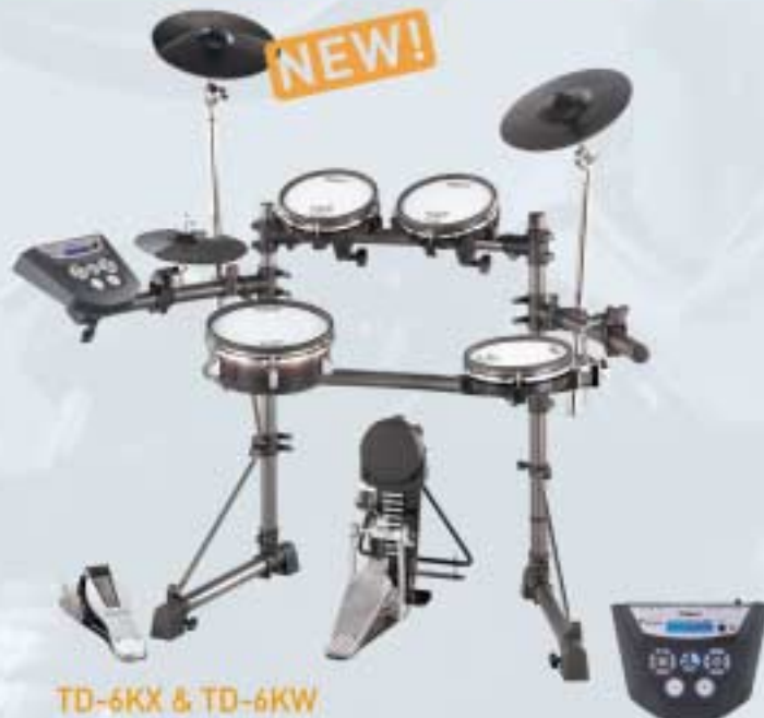
TD-6KX & TD-6KW V-Drums V-Tour Series (afbeelding: TD-6KX)