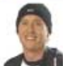
Josh Freese A Perfect Circle