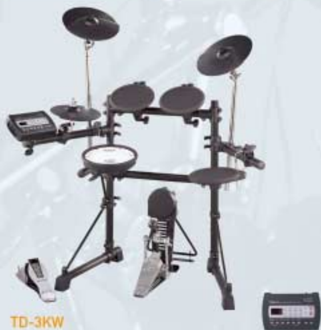
TD-3KW V-Drums V-Compact Series