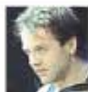
Lars Ulrich Metallica

For nearly 50 years, touring artists have demanded that their drumheads deliver uncompromised sound and durability.