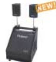
PM-30 Personal Monitor Amplifier