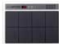
SPD-20 Percussion Pad