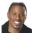
Gordon Campbell George Duke, Jessica Simpson