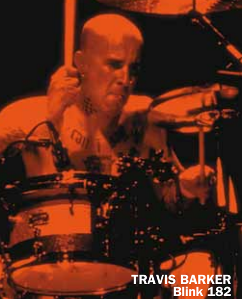
TRAVIS BARKER Blink 182