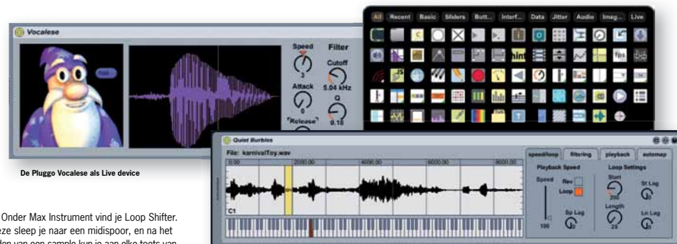
De Pluggo Vocalese als Live device

Met de eerder genoemde paradepaardjes hebben we een shifter, een sequencer en een shuffler. Elk van deze drie categorieën heeft een eigen, speciaal voor Max For Live gecreëerd, device.