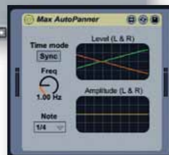
Dezelfde AutoPanner als Live device

Alles geïnstalleerd en geactiveerd? Dan kan de lol beginnen. Omdat Max For Live perfect in Ableton Live is geïntegreerd, werkt het gebruik van de nieuwe devices in Live voor je eigen