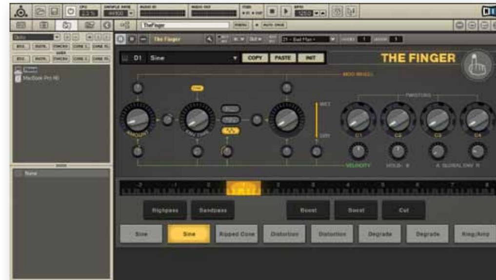
De gui van The Finger in Reaktor.