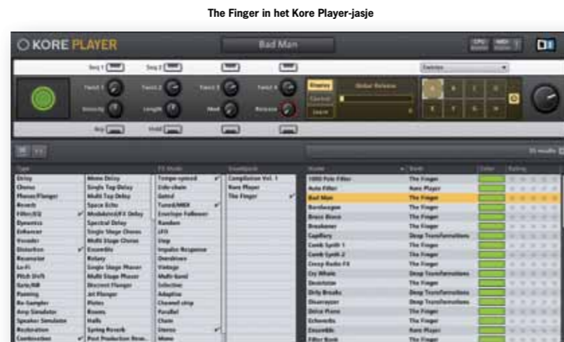
The Finger in het Kore Player-jasje

Voor gebruikers van Reaktor heeft Native Instruments nog een verrassing in petto. Omdat The Finger met Reaktor is gemaakt, kun je het gewoon als ensemble laden. Hierbij hoeft je niet met de standaard Kore Player gui te werken, maar heb je echt alle controle onder je vingers. Je kunt nu aan