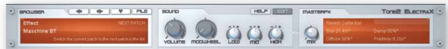
Als je alleen presets van ElectraX wilt gebruiken, kun je het editpaneel verbergen.