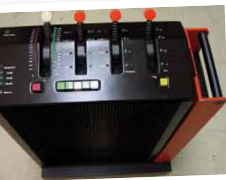
De originele hardware-eenheid

In 1976 introduceerde EMT (destijds bekend van plaatgalmunits) de EMT 250. Dit was de eerste digitale reverb ooit. Hij klonk nog geweldig ook en zag eruit als het bedieningspaneel van een ruimtetractor. Het apparaat was één meter hoog met koelribben aan drie kan-