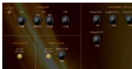
Elk instrument heeft een eigen pagina met bij het instrument passende extra instellingen.